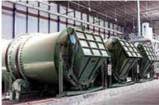
Compostaje en tambores rotativos