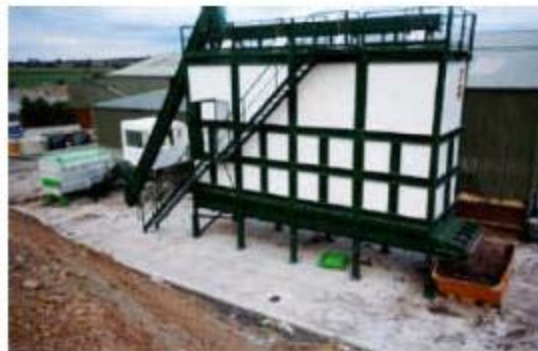
Compostaje en reactor vertical

adibide hauetan ikusten da leku askotan erabiltzen diren ereduak.