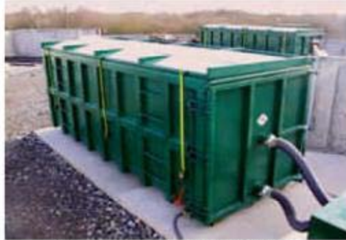
Compostaje en contenedores

HERRIAN KONPOSTA EGITEA HONDAKIN ORGANIKOEKIN.