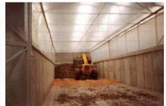
Compostaje en túnel